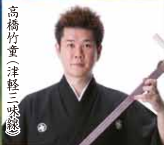
高橋竹童(津軽三味線)